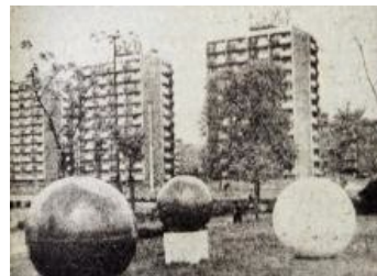
Miejska biżuteria dla Kopernika