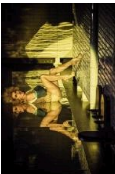
"Kabaret warszawski" reż. Krzysztof Warlikowski

źródło: Nowy Teatr autor: Magda Hueckel + Zobacz więcej zdjęć